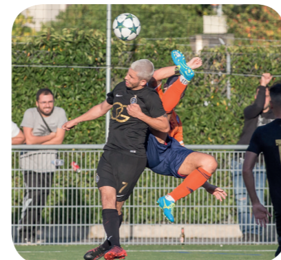
FC Olympique de Genève - FC Aire Le Lignon