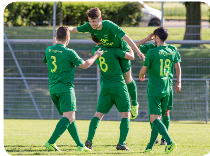
FC Veyrier Sports - FC Onex