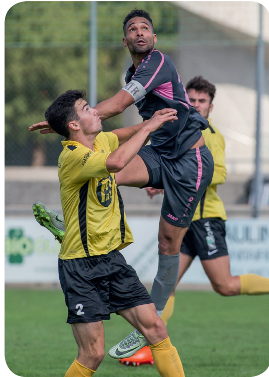
FC Lancy - FC Meyrin