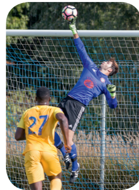
FC Plan-Les-Ouates - FC Aïre Le Lignon