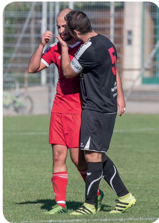
FC Saint Paul - FC Grand Saconnex