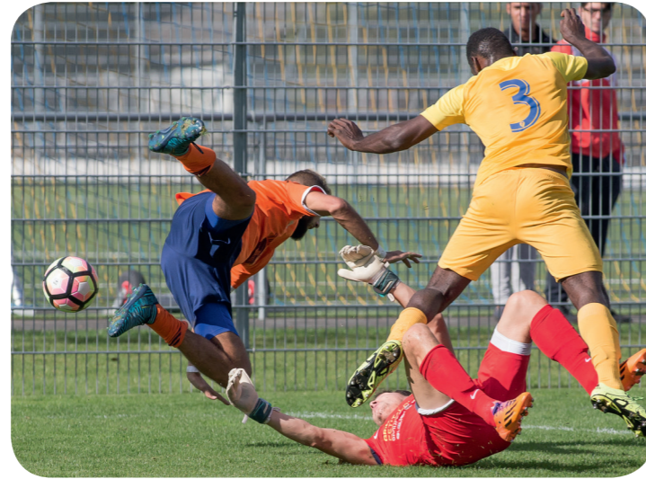
FC Plan-Les-Ouates - FC Aïre Le Lignon