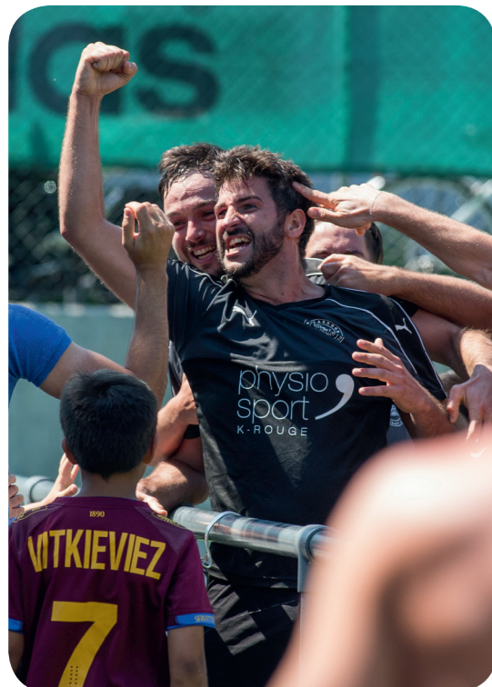
US Carouge - FC Perly Certoux