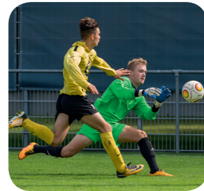
FC Lancy - FC Meyrin