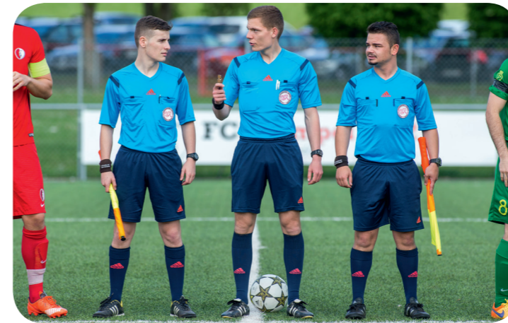
FC Champel - FC Veyrier Sports