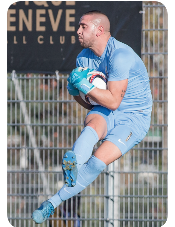
FC Olympique de Genève - FC Aïre Le Lignon