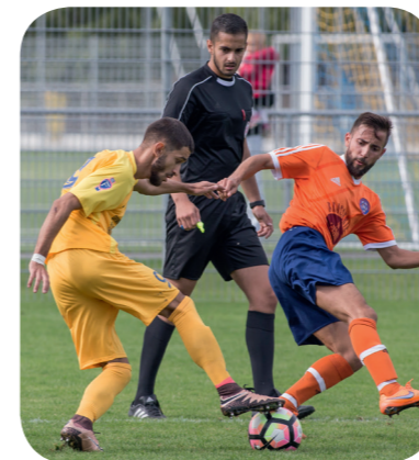
FC Plan-Les-Ouates - FC Aïre Le Lignon