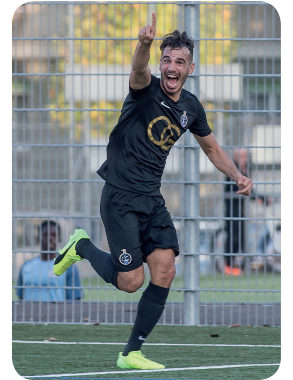
FC Olympique de Genève - FC Aïre Le Lignon