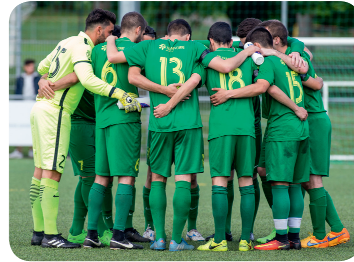
FC Champel - FC Veyrier Sports