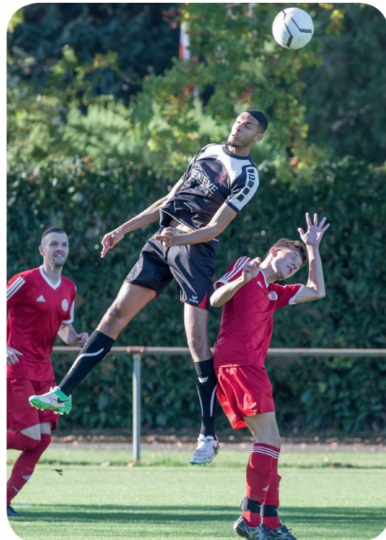
FC Saint Paul - FC Grand Saconnex