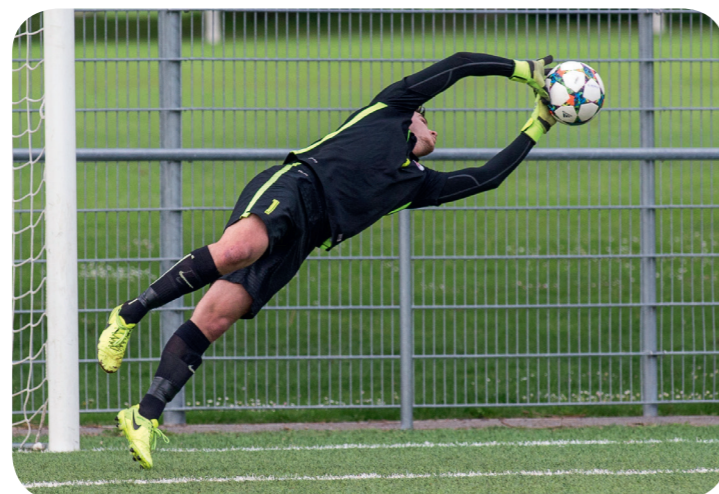
FC Champel - FC Veyrier Sports