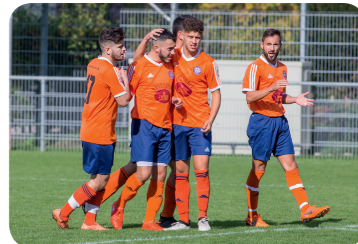
FC Plan-Les-Ouates - FC Aire Le Lignon