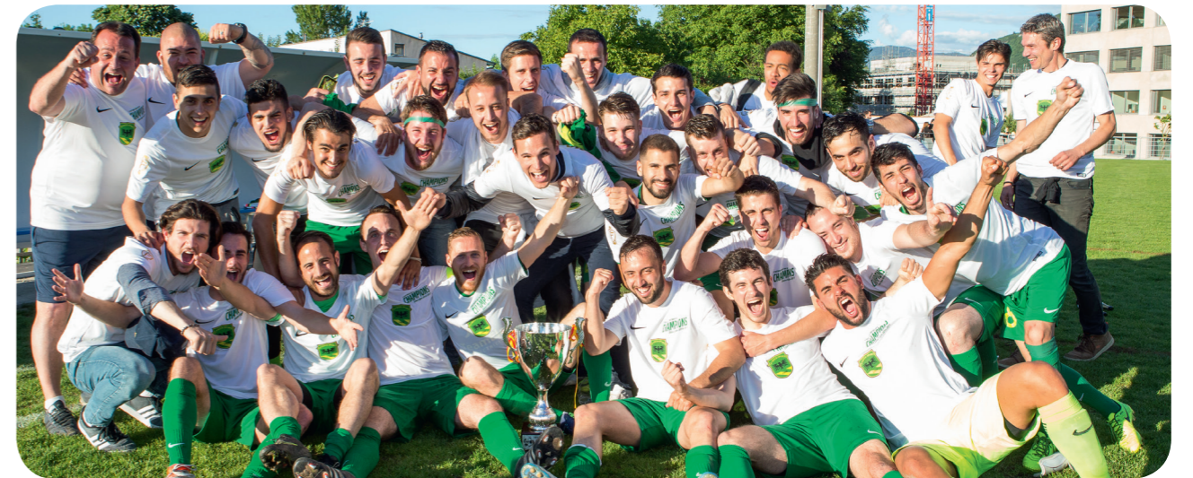
FC Veyrier Sports - FC Onex