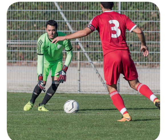
FC Saint Paul - FC Grand Saconnex