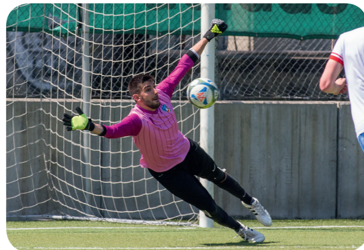
US Carouge - FC Perly Certoux