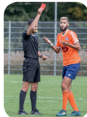
FC Plan-Les-Ouates - FC Aire Le Lignon