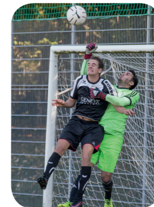
FC Saint Paul - FC Grand Saconnex